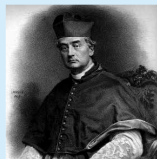
Card. Fabio Maria Asquini (1802–1878)

Il racconto del ritrovamento e della traslazione è narrato nel libro sulla storia di Fagagna scritto dall'allora parroco don Angelo Tonutti e dedicato al matrimonio dei Conti Fabio Asquini e Angela Panciera di Zoppola (1914). In occasione della traslazione venne composto dal musicista cividalese Jacopo Tomadini (1820–1883) l'inno proprio dei due S. Martiri. La musica viene considerata “un gioiello squisito di musica sacra” . Al responsorio proprio dei S. Martiri Papa Pio IX concesse particolari indulgenze.